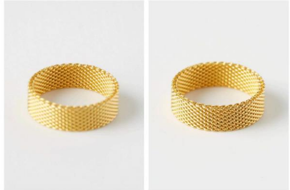
Mise au point au mauvais endroit