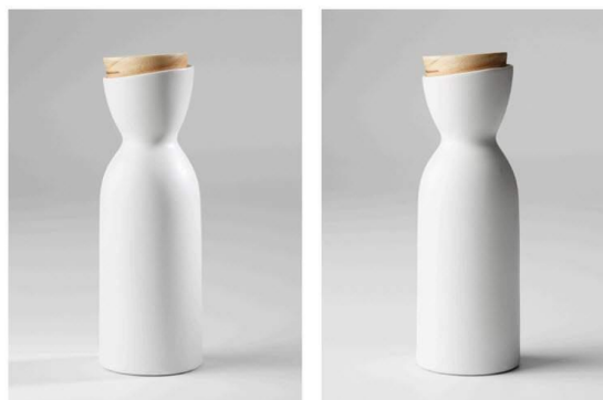
Deux sources de lumières dans des directions opposées