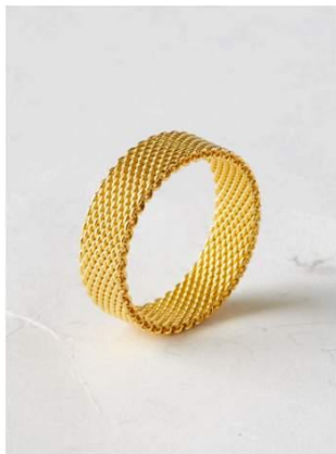
Fond sale et abîmé