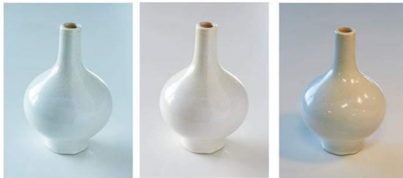
Mauvaise balance des blanc