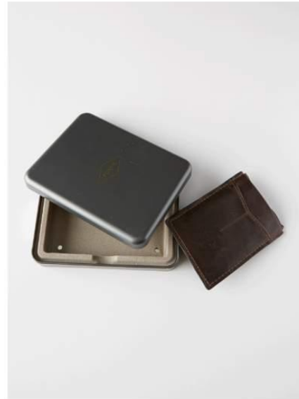
Composition horizontale moins appropriée pour un cadrage vertical.

Le placement de l'objet met plus en valeur la boîte que le portefeuille.