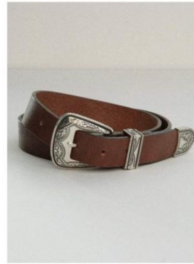
Image trop granuleuse