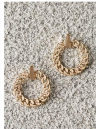
Mauvais choix de fond pour l'objet